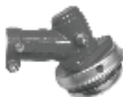
Редуктор в сборе