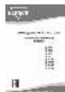
Руководство по эксплуатации