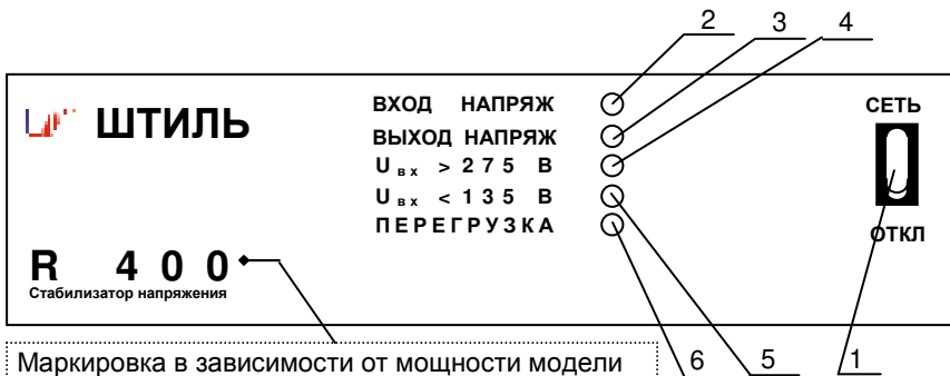
Рисунок 4.1 Передняя панель стабилизатора

Непрерывное свечение красного индикатора « U_{вх} > 275 \text{ В} » (4) свидетельствует о превышении предельного значения входного напряжения ( U_{вх} > 275 \text{ В} ) и отключении нагрузки, мигание – входное напряжение за пределами рабочего диапазона ( 260 \text{ В} < U_{вх} < 275 \text{ В} ), но нагрузка подключена.