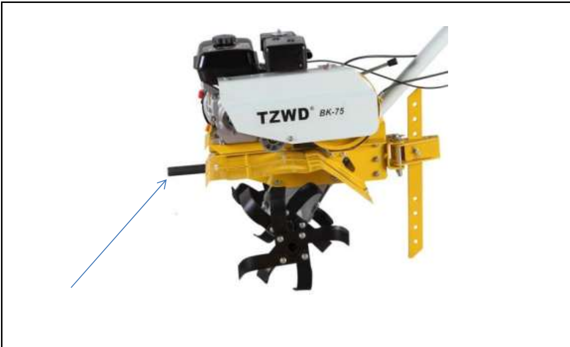
рисуно к 7