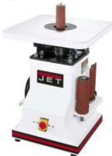
Осцилляционный шпиндельный шлифовальный станок JBOS-5

BMX Тул Груп АГ (WMH Tool Group AG) Банштрассе 24, CH-8603 Шверценбах