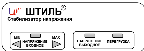
Рисунок 4.1 Передняя панель стабилизатора

На одной боковой стенке стабилизатора расположена розетка с заземляющим контактом для подключения нагрузки, а на другой – автоматический предохранитель 2А (у стабилизатора R250ST) или 5А (у стабилизаторов R400ST, R600ST), или 10А (у стабилизатора R800ST), выключатель СЕТЬ и выведен сетевой шнур для подключения стабилизатора к сети.