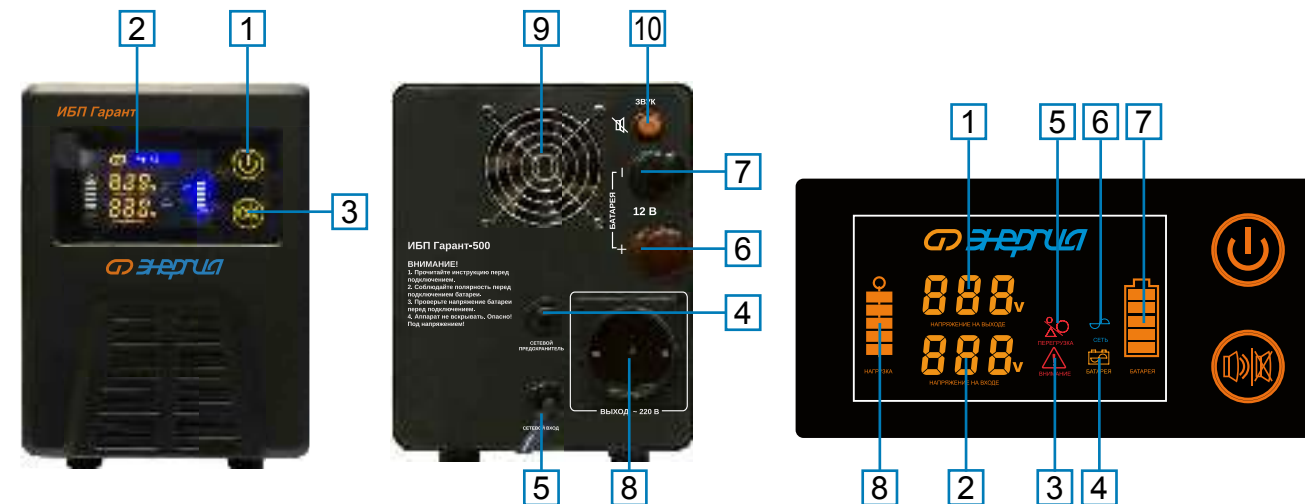
Панель индикации (б)

Модели ИБП Гарант-500, 750, 1000, 1500, 2000