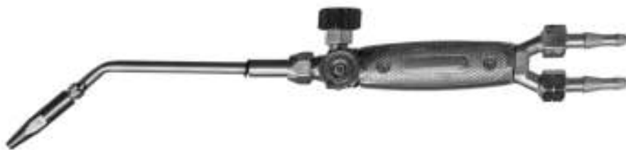
Рис.1- Общий вид горелки

Горелка состоит из ствола и комплекта наконечников. Ствол горелки имеет регулировочные вентили кислорода и пропан-бутана. К стволу по резиновым рукавам