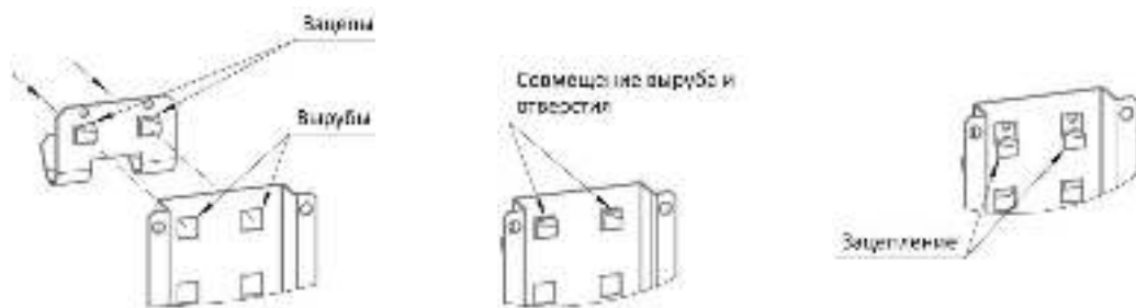
Рисунок 4 - Установка навесных элементов.

Для установки необходимо совместить квадратные вырезы на перфорированном профиле, либо на перфорированной панели с зацепами на навесных элементах, после чего опустить навесной элемент вниз до упора, создавая зацепление между перфорированной панелью и навесным элементом (Рис. 4).