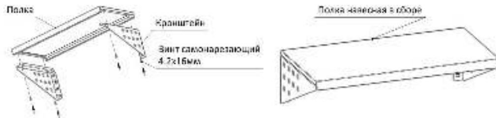
Рисунок 2 - Установка перфорированной профиля и перфорированной панели.

Установить кронштейн во внутреннюю часть полки, таким образом, что бы гиб в верхней части кронштейна был обращен во внутрь полки. Зафиксировать при помощи винтов самонарезающих 4,2x16мм (Рис. 2).